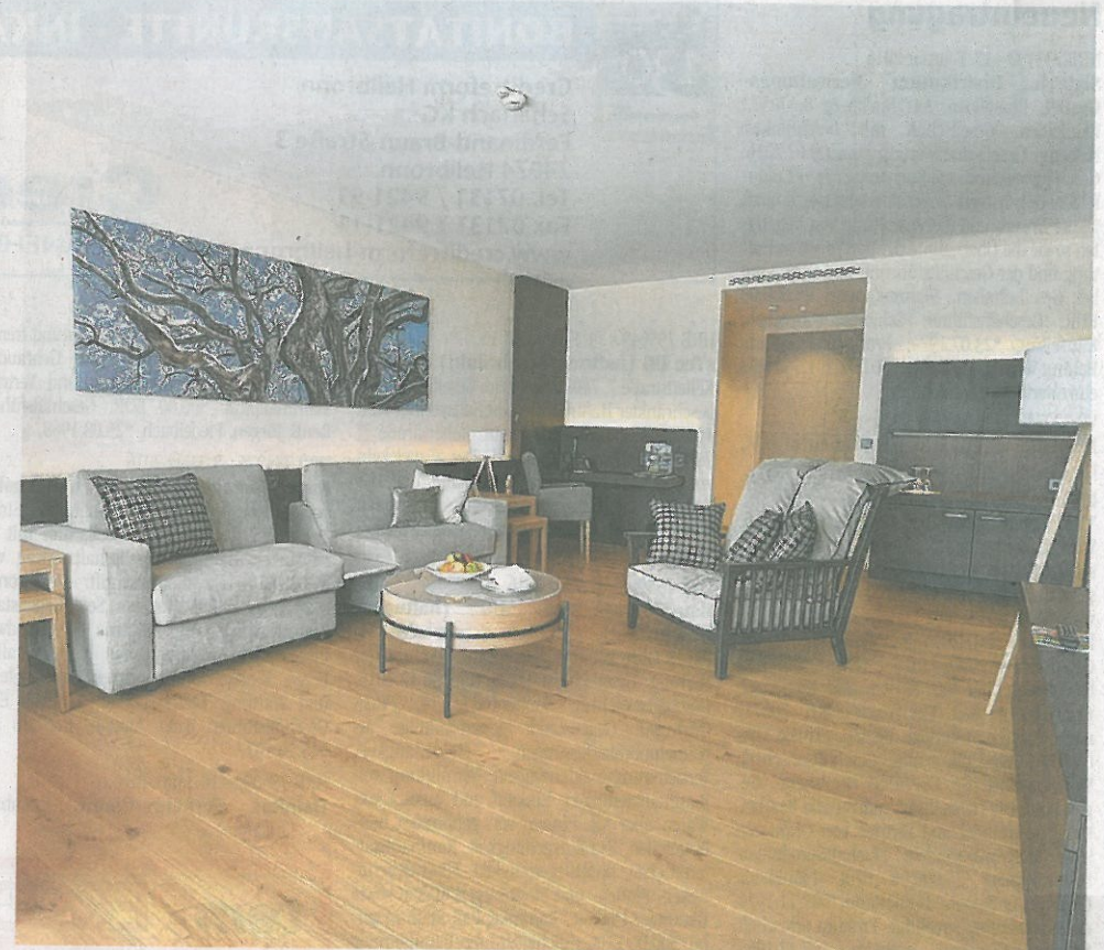
Neuheit: Neun Suiten für bis zu fünf Personen ergänzen nun das Angebot im Naturresort.