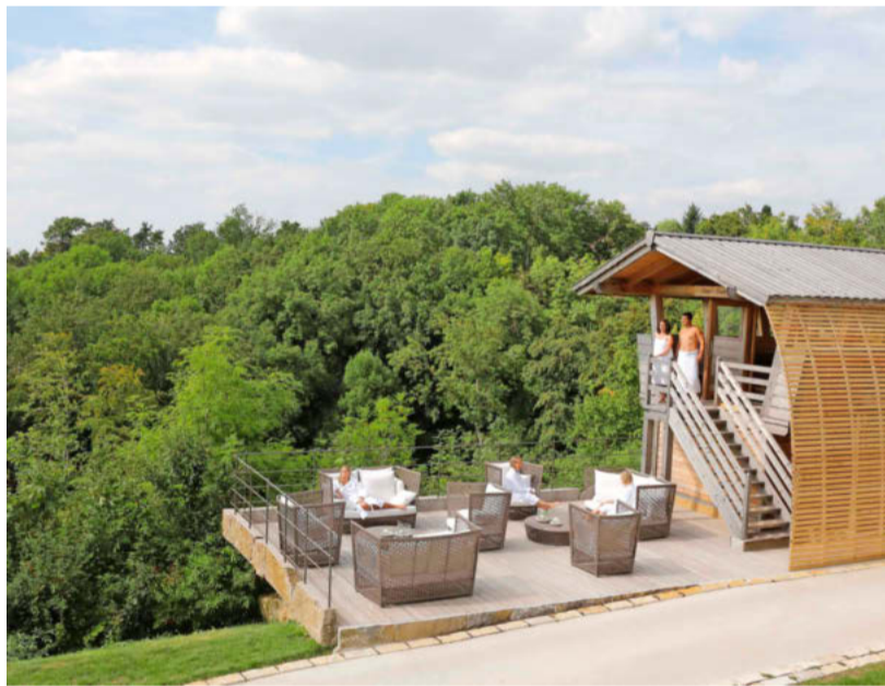
Die Jäger-Sauna im Außenbereich mit Blick übers Jagsttal.

Das Wellnessresort Mawell in Langenburg boomt mit naturnahem Konzept – Kurzurlaub auch für Gäste aus der Region